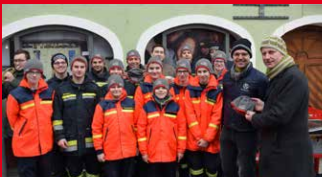
Kiwanis Schärding – Spende Jugendgruppe