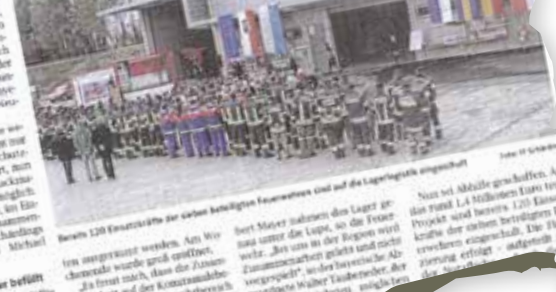
Über 120 Einsatzkräfte der vier beteiligten Feuerwehren sind auf die Lagerfläche eingetroffen.

SCHÄRDING. Das große, im Gemeindegebiet von Schärding errichtete Katastrophenschutz-Lager des Hochwasserschutzes ist ab Ende Dezember einsatzbereit. Es handelt sich um ein einzigartiges Projekt, bei dem vier Gemeinden an einem Strang ziehen. St. Florian und der bayerische Nachbarort Neuhausen am Inn.