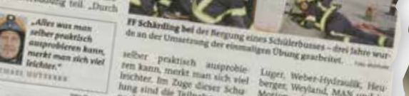
FF Schärding bei der Bergung eines Schulbusses – drei Jahre wurde an der Umsetzung der einmaligen Übung gearbeitet.

Drei Jahre lang bereitete die FF Schärding ein einmaliges Spezialseminar vor ST. FLORIAN/1. (mal). „Patientengerechte Menschenrettung mit Bus und LKW“, so lautet der Arbeitstitel eines einwöchigen Spezialseminars, organisiert von der FF Schärding. Rund 45 Einsatzkräfte der Feuerwehren Schärding, St. Florian und Rottstett (Bayern) nahmen am Gelände der Firma Mercedes Lager in Haal an dieser Weiterbildungsmaßnahme teil.