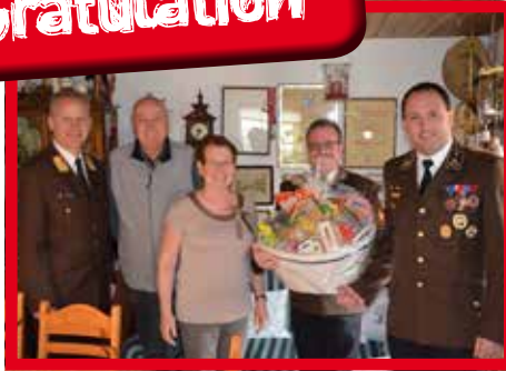
75er Ferry Gstöttner