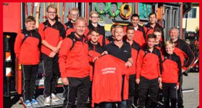
Fa. Heiningner – Spende Jugendgruppe (Trainingsanzüge)