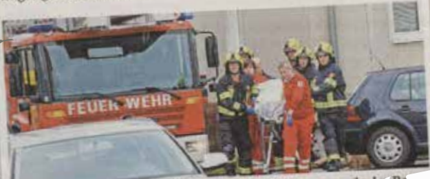
Zur Personenrettung in der Herbert-Wöhl-Straße wurde der Rettungshubschrauber „Europa 3“ angefordert.

Drehleiter erkundet. Das Rote Kreuz fand die Person bei Bewusstsein am Boden liegend vor. Weil der Gesundheitszustand einen sofortigen Transport nicht zuließ, wurde der Rettungshubschrauber „Europa 3“ angefordert. Da eine Bergung mittels Drehleiter auf Grund des fehlenden Stellplatzes nicht möglich war, wurde der Patient über das enge Stiegenhaus gerettet und ins LKH Schärding gebracht.