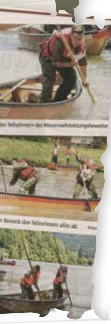
Hochkonzentration und voller Einsatzgeist war von den Teilnehmerinnen des Wasserwehrleistungsbelegs zu sehen.

WASSERWEHRLEISTUNGSBEWERB ZILLENFISCHER. In Kasten (Gemeinde Vachstein) fand der 27. Bezirks-Wasserwehrleistungsbeleg des Bezirkes Schärding bei besten Wetterbedingungen statt. Nur der Wind machte den Bewerbern zu schaffen, bei aber auch Bedingungen, die man auch bei Einsätzen vorfindet. 163 Zillenbesatzungen aus dem Bezirk Schärding sowie Gästegruppen aus ganz Oberösterreich nahmen am Bewerb teil.